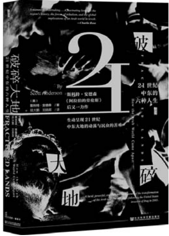
《破碎大地》 [美] 斯科特·安德森 著 社会科学文献出版社

一部探究增长与衰退的经济著作：美国何以成就繁荣，又为何陷入衰退。一部鲜活深刻的美国经济社会发展史，一幅广阔的美国社会画卷。