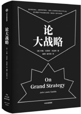
《论大战略》 [美] 约翰·刘易斯·加迪斯 著 中信出版集团

不仅国家和政府需要大战略，目标与手段的相一致，同样适用于个人的事业和生活。每个人都需要大战略思维，掌控全局的能力。从作者勾勒出的上千年世界战略历史中，可以观察到国家兴衰的各种印记。