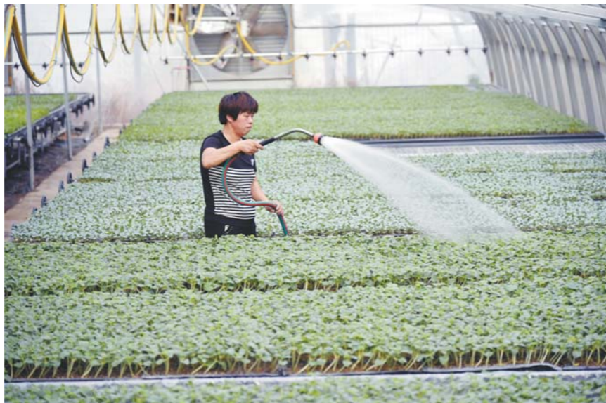
7月4日,聊城市茌平县贾寨镇那胡刘村村民管理大棚。当日,聊城市继续发布高温橙色预警信号,部分地区最高气温在37℃以上。

3日下午到傍晚,鲁东南和半岛北部的局部地区出现雷雨或阵雨天气。降水数据显示:3日6时至4日6时,全省共有28县(区、市)、226乡镇出现降水,平均降水量0.2毫米,折合水量约0.3亿立方米。降水量最高为日照巨峰27.6毫米。今年以来全省平均降水量