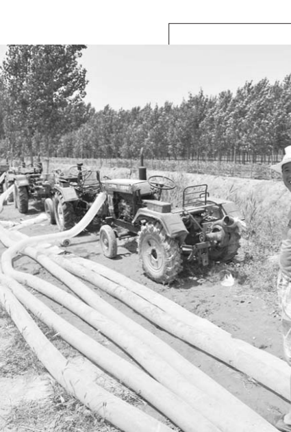
□程芃芃 马景阳 报道

“从重点人、重点事入手，通过梳理其工作流程，结合谈话、信访、财务方面发现的蛛丝马迹，选准突破口，深挖深查，从而找出有价值的线索。”加入巡察队伍不到一年的80后巡察干部苗蕾，在“巡察大讲堂”上分享着她的心得体会。“第一次由‘学生’变‘老师’，还有点紧张，‘巡察大讲堂’既能畅通交流渠道、强化担当意识，又能提升发现问题、解决问题的能力水平，为我们提供了锻炼和展示的平台。”苗蕾说。