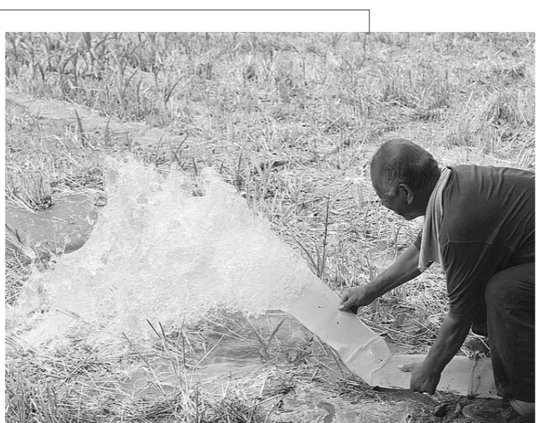
□程芃芃 马景阳 报道

□记者 卢鹏 通讯员 赵玉国 报道 7月2日，茌平县贾寨镇，村民用机械抽取沟渠中引来的黄河水，给玉米地灌溉。