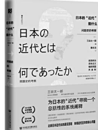
《日本的近代是什么》 【日】三谷太一郎 著 社会科学文献出版社

一个飞蛾扑火的女人，卷入了一场玉石俱焚的人生豪赌。是智力拼搏，更较量人性本质中那最终的成色……对这场必输的赌局，是自我毁灭抑或自我拯救？