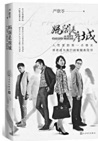
《妈阁是座城》 严歌苓 著 人民文学出版社

一个飞蛾扑火的女人，卷入了一场玉石俱焚的人生豪赌。是智力拼搏，更较量人性本质中那最终的成色……对这场必输的赌局，是自我毁灭抑或自我拯救？