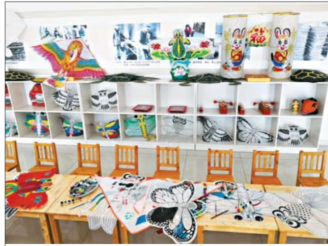
风筝文化馆的研学区