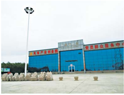
王家庄子风筝文化馆外景。