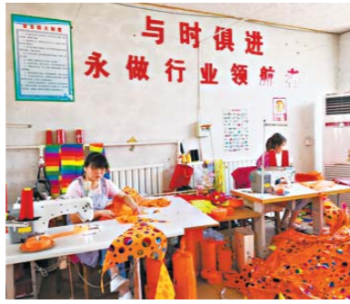
国言风筝厂的工人在缝制风筝。