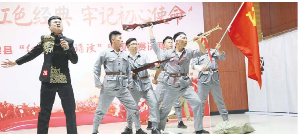
□森林 如庆 李明 报道

当前,东营发展进入了转型升级的关键时期,为了让党员和支部更好地发挥带动作用,东营市坚持以党建为引领,以提升组织力为重点,把“夯实基层基础”三年行动计划作为抓手,筑牢基层党建“钢铁长城”。一名党员就是一面旗帜,一个支部就是一座堡垒。如今,东营市党员队伍素质大幅度提升,支部带动作用明显增强,全市上下党建工作迈上了一个新的台阶。