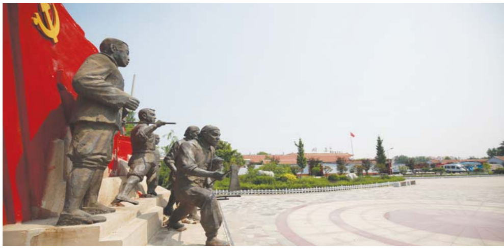
刘集后村的宣言广场。

6月20日下午,东营市纪委监委机关第七党支部与东营经济技术开发区党工委支部开展“守初心,担使命,走进动能转换主战场”联合主题党日活动。