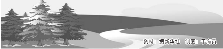
制图：于海员

是指保护重要的自然生态系统、自然遗迹和自然景观，具有生态、观赏、文化和科学价值，可持续利用的区域。确保森林、海洋、湿地、水域、冰川、草原、生物等珍贵自然资源，以及所承载的景观、地质地貌和文化多样性得到有效保护。包括森林公园、地质公园、海洋公园、湿地公园等各类自然公园。