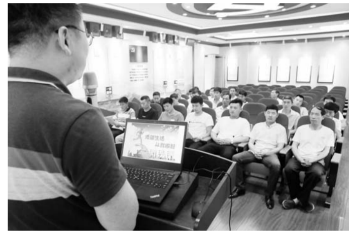
6月19日,山能临矿集团新驿煤矿团委组织青年志愿者开展了以“节能我行动、低碳新生活”为主题的节能宣传周活动,倡导选择简约适度、绿色低碳的生活方式。(刘娟 张行)