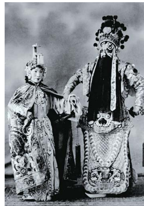
20世纪30年代,李苦禅先生曾出演过京剧《霸王别姬》,上图为其扮项羽的剧照。

李苦禅先生是中国现代大写意花鸟画大师,人民美术教育家,自幼深受家乡传统文化熏陶,以毕生精力在中国画艺术中执着追求,德艺双馨,为世人所崇敬。他曾任中央美术学院教授、中国画研究院委员、中国美术家协会理事及中国人民政治协商会议第五届、六届全国委员会委员。