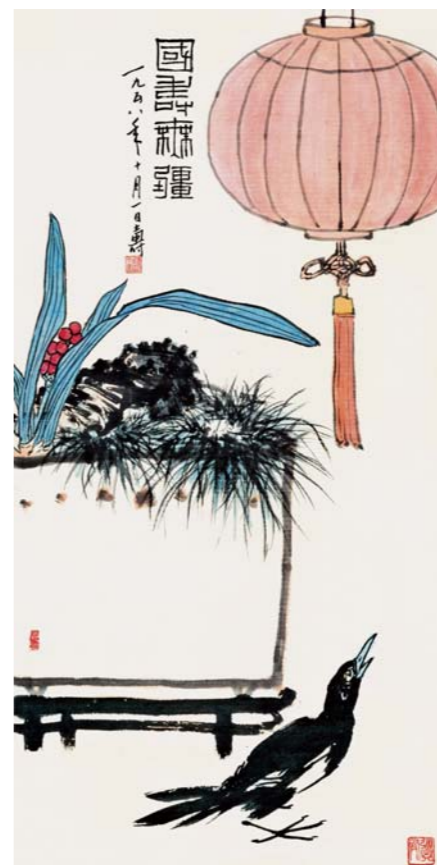
潘天寿 国寿无疆图