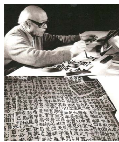
李苦禅每日练书不止,直到去世前6小时才放下摹帖的毛笔。