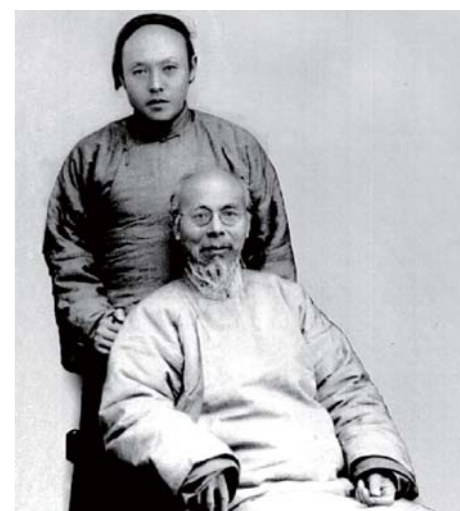
齐白石与李苦禅皆是中国美术界的大师巨匠,引领了大写意花鸟画的新风范,他们除了对中国画的发展做出了突出贡献外,他俩的师生情缘和君子之交也书写了20世纪中国绘画史上感人至深的一页。