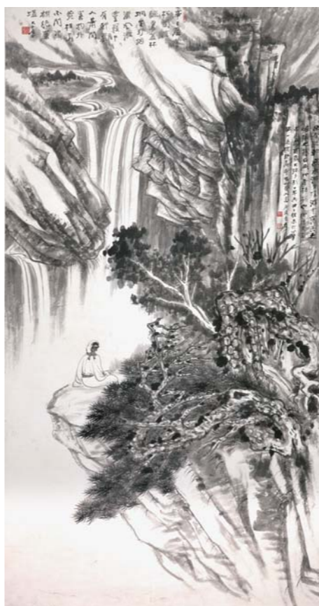
张大千 仿石涛松泉图