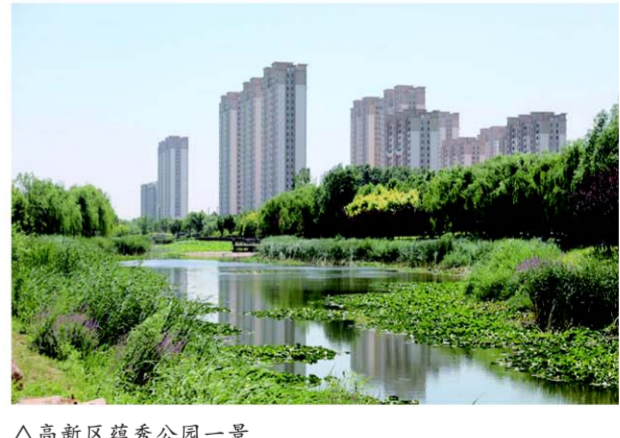
△高新区益秀公园一景