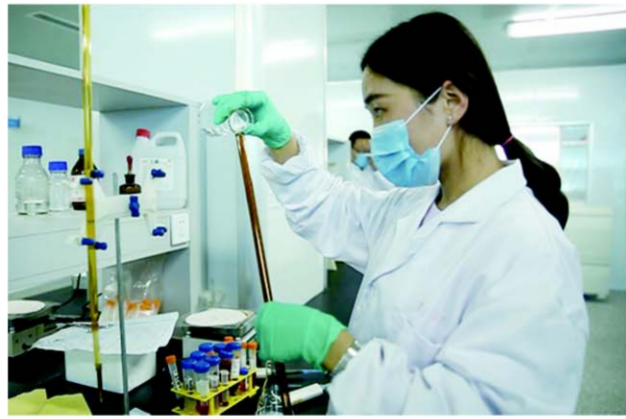
△高新区九州生物产业园内研发场景