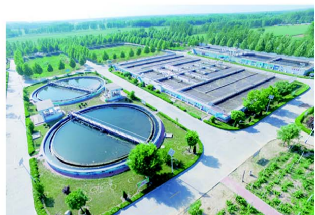
△国环产业集团污水处理设施