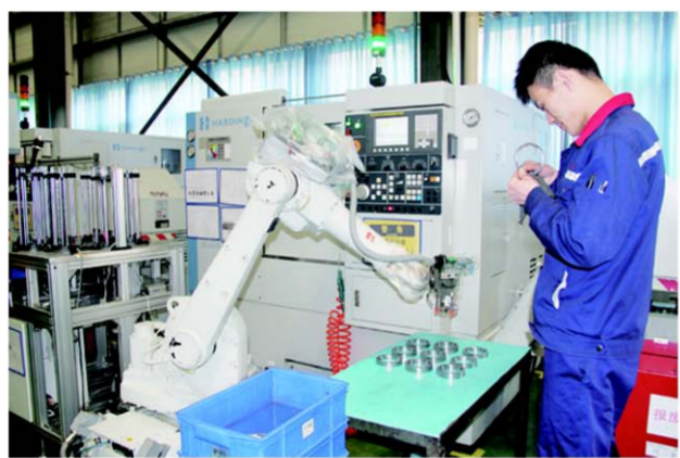
△财金博源节能生产车间