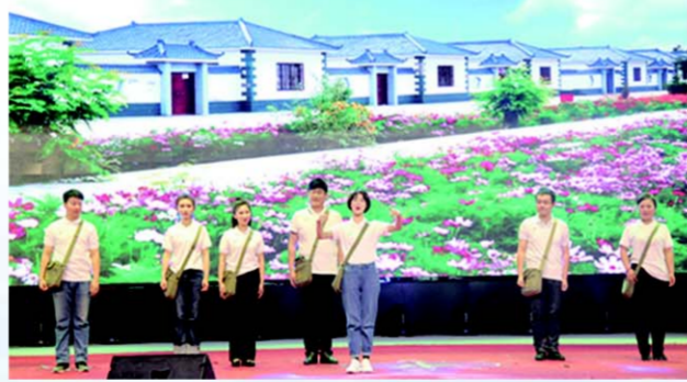
△高新区红色挎包宣传队表演天津快书《红色挎包展风采》