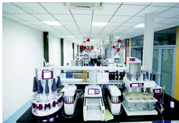
△高新区生物研发中心