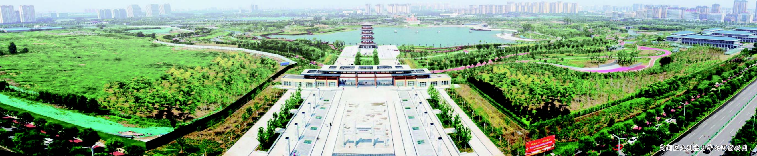
高新区九州洼月亭公园俯拍图