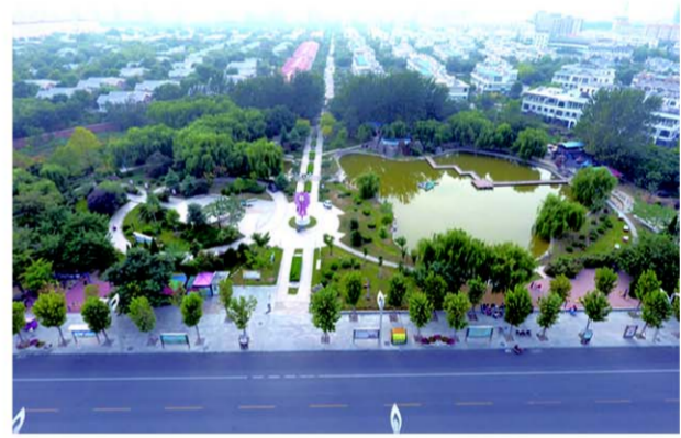
△高新区城市建设一景