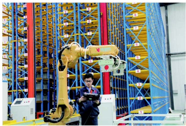
△高端装备制造企业诺伯特智能装备智能仓储系统