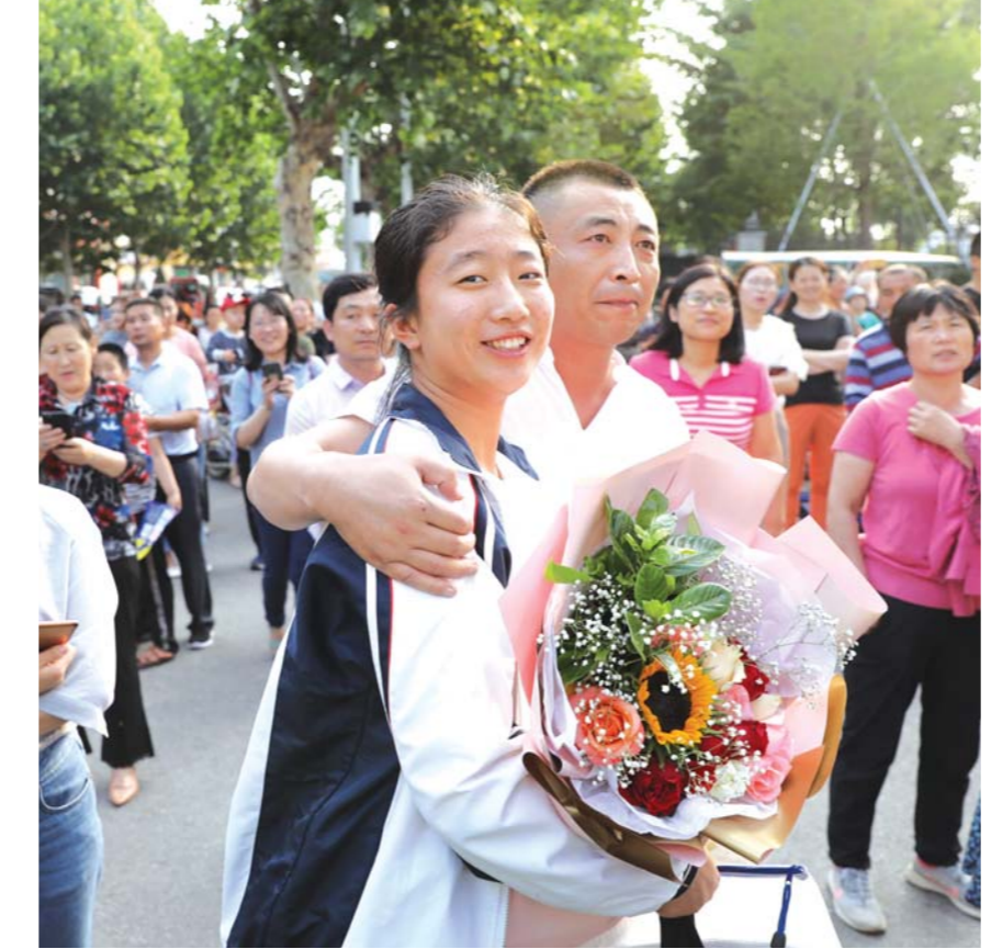
6月8日,我省2019年高考落下帷幕。莒县一中考点,考生们走出考场。考场外,考生家长及亲友翘首以待,用微笑、拥抱和鲜花迎接经历了两天大考的考生。

按方案,合格考试每学年组织2次,分别安排在每学年上、下学期末,普通高中在校生期间有多次考试机会;而等级考试每年组织1次,时间安排在6月份夏季高考(统一高考)后进行,计划在6月9日-10日完成,普通高中在校生期间只能参加1次考试。