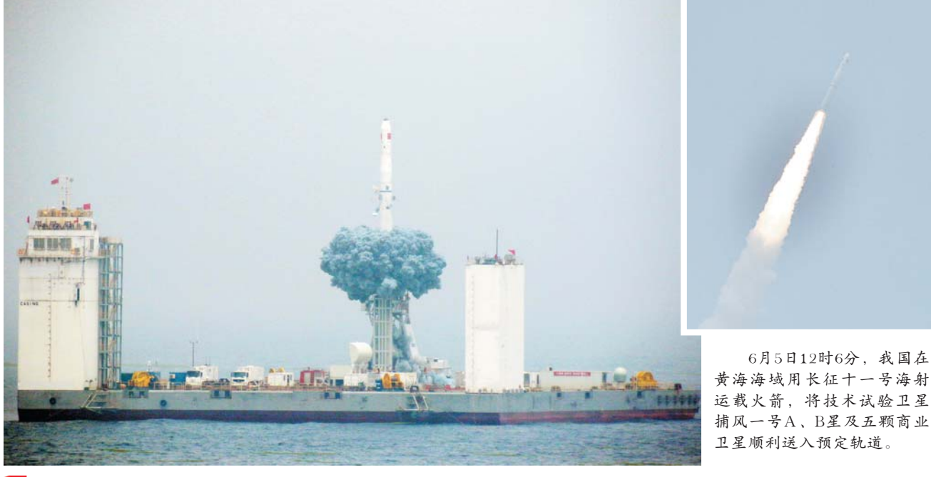
6月5日12时6分,我国在黄海海域用长征十一号海射运载火箭,将技术试验卫星捕风一号A、B星及五颗商业卫星顺利送入预定轨道。

新华社青岛6月5日电 2019年6月5日12时6分,我国在黄海海域用长征十一号海射运载火箭,将技术试验卫星捕风一号A、B星及五颗商业卫星顺利送入预定轨道,试验取得成功。这是我国首次海上实施运载火箭发射技术试验。 此次试验采用长征十一号海射型固体运载火箭(又名CZ-11 WEY号),以民用船舶为发射平台,探索了我国海上发射管理模式,验证了海上发射能力,有利于更好地满足不同倾角卫星发射需求。