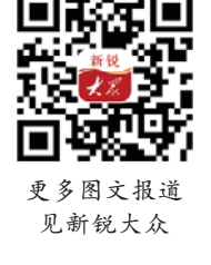
更多图文报道 见新锐大众

程序操作和综合信息处理工作;对星上设备任务模块的运行进行高效可靠的管理和控制,测量和监视全球状态,协调调整的工作,配合有效载荷实现飞行任务的各种动作和参数的重新设置,以完成预定的飞行任务,获取相应的结果。 星务组件采用模块化设计,具备高集成度、低成本、高可靠等特点,一个模块即实现一台单机产品的完整功能,极大降低了重量、体积和功耗。星务组件拓宽了513所星务系统的产品体系,开辟了低成本卫星设计的新思路。 513所还在长征十一号运载火箭地面分系统中承担了关键单机——直流断路盒的研制任务。直流断路盒隶属于火箭控制系统,主要实现主节点和从节点间设备的热切换控制功能。该设备结构小巧便携,便于车载,同时通过严谨的设计和严格的测试验证,保障设备具有极高的可靠性,为发射任务的顺利进行保驾护航。