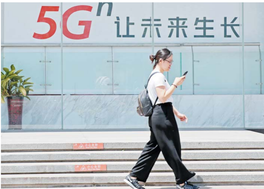
近期，工业和信息化部将发放5G商用牌照，我国将正式进入5G商用元年。