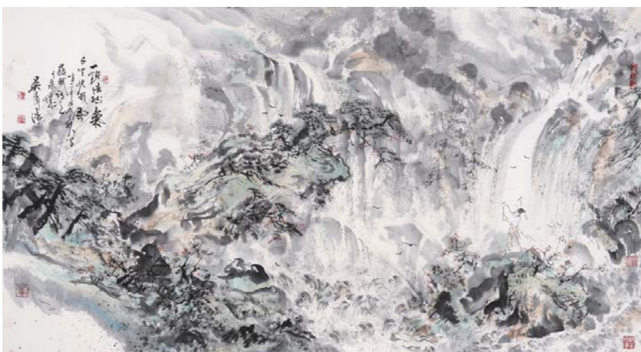
一点浩然气 千里快哉风