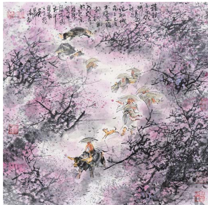
记取城南上巳日 木棉花落刺桐开