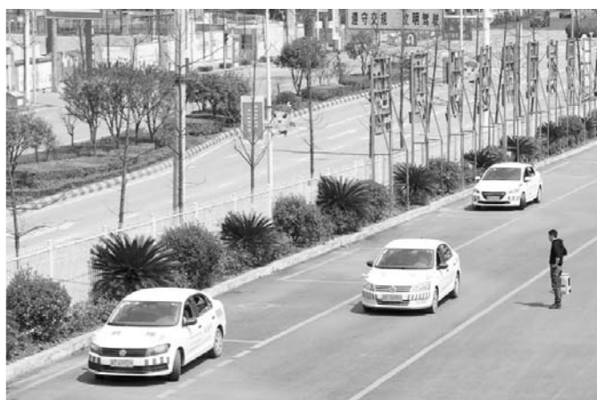
6月1日起,驾考分科目考试异地可办。