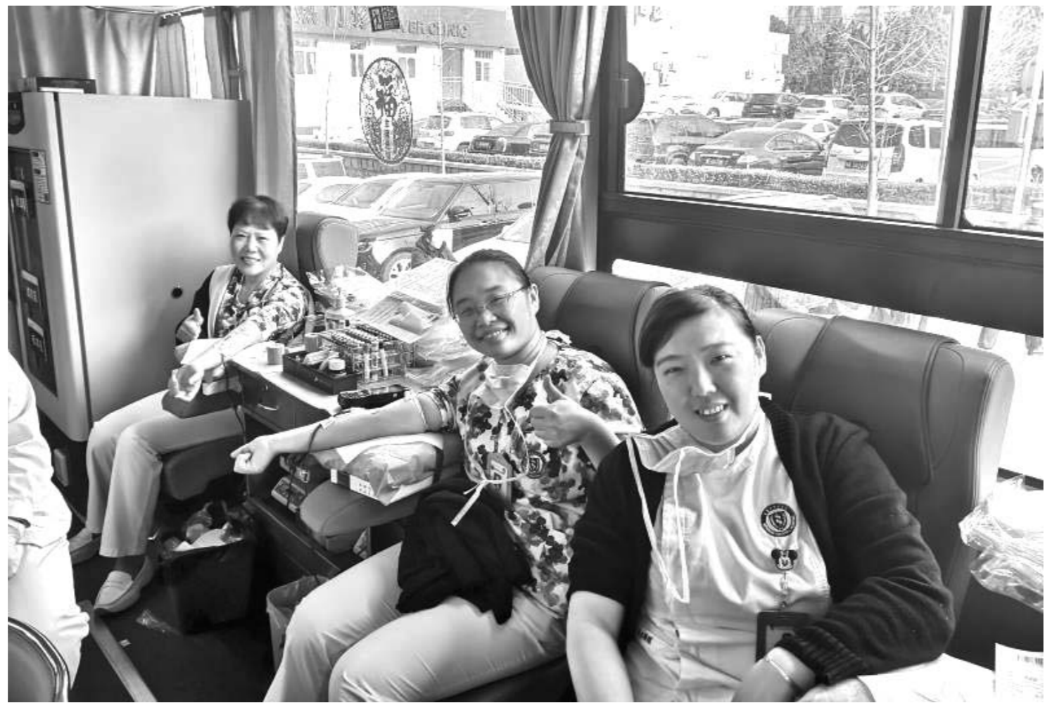
□杨杰 伊丽明 王凯 报道 近日,青岛市市立医院163位白衣天使走上“万人流动血库”献血车,伸出爱的臂膀,无偿献血34800毫升,给予更多渴望生命延续、渴望病体康复的患者以选择希望的可能。图为医护人员在现场采血。