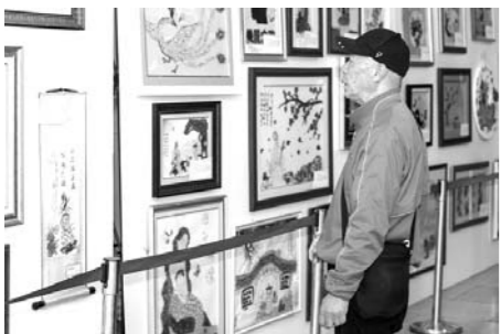
□范晓革 刘伟 王凯 报道 近日,青岛市海慈医疗集团在国医堂大厅内展出32幅用中草药叶做成的五禽戏、京剧脸谱、赤松图、松鹤延年图等画作,吸引了就诊市民纷纷驻足欣赏。

学知识培训咨询、著作刊物编辑出版等方面提出详细工作计划。作为医学伦理学的热心传播者、宣传者和实践者,要让医学伦理学的精神融入每家医疗机构的理念、传统、文化中,融入每位医务工作者的思想行为中。