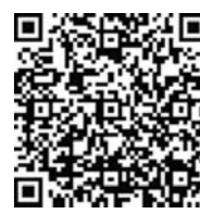
阅读全文请扫描 新锐大众二维码

新华社北京4月30日电 人民日报5月1日发表评论员文章《建设美丽中国是我们心向往之的奋斗目标——论学习领会习近平主席在北京世界园艺博览会开幕式上重要讲话精神》。 文章说，“建设美丽中国已经成为中国人民心向往之的奋斗目标”，习近平主席在2019年中国北京世界园艺博览会开幕式上发表重要讲话，深刻总结了推动生态文明建设的生动实践，深入阐释了弘扬绿色发展理念的深刻内涵，向世界展示了建设美丽中国的坚强决心，宣示了追求绿色发展、建设生态文明的坚定意志。 文章说，建设美丽中国，需要坚持习近平生态文明思想。建设美丽中国，需要走好绿色发展道路。建设美丽中国，需要从我做起、从现在做起。长城脚下，妫水河畔，北京世园会再次展现中国人民对绿色生活、美丽家园的向往。