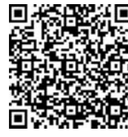
阅读全文请扫描 新锐大众二维码

新华社北京4月30日电 人民日报5月1日发表评论员文章《言必信 行必果——五论学习领会习近平主席在第二届“一带一路”国际合作高峰论坛开幕式上关于扩大对外开放的重要讲话精神》。 文章说，“中国人历来讲求‘一诺千金’。”习近平主席在第二届“一带一路”国际合作高峰论坛开幕式上强调，中国将更加重视对外开放政策贯彻落实，向国际社会展示了负责任、守信誉的大国形象和担当。落实好对外开放政策，必须加强法治建设、诚信建设，落实好对外开放政策，必须转变政府职能，落实好对外开放政策，需要探索建立有效的国际协议履约执行机制。行动最有说服力，落实才见真功夫。各地区各部门在本职工作中要以实际行动推进对外开放、履行国际协议承诺。