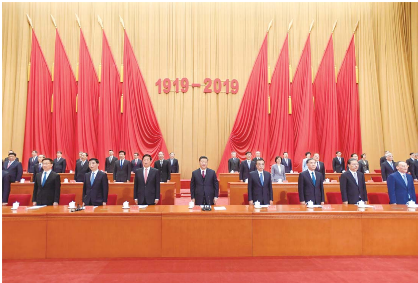
4月30日，纪念五四运动100周年大会在北京人民大会堂隆重举行。中共中央总书记、国家主席、中央军委主席习近平在大会上发表重要讲话。