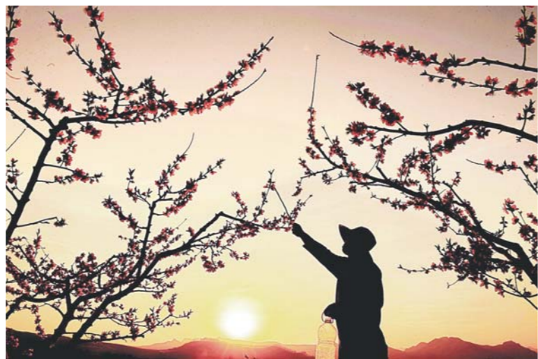
□新华社发 花开四月 大美齐鲁 时值四月,正是齐鲁大地花开时节,农民田间劳作,游客花海徜徉,处处洋溢着浓浓春色。

建设工地、11个农村(城市社区)、5家卫生院、1处垃圾收集站等113个点位进行了检查,形成了重点问题清单。执法检查时,再次安排专家及部分省、市、县三级人大代表全程参与。