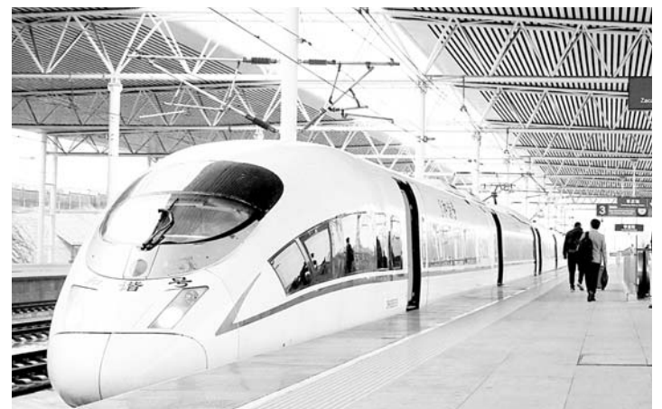
4月10日零时起，全国铁路迎来新一轮运行图调整。

□记者 常青 报道 本报济南4月9日讯 记者从京沪高铁济南西站获悉，4月10日零时起，全国铁路将迎来新一轮运行图调整，这也是今年进行的第二次调图工作。根据新图安排，济南东西两站间“高铁公交”将加密，部分济青高铁列车始发站延伸至济南西站。