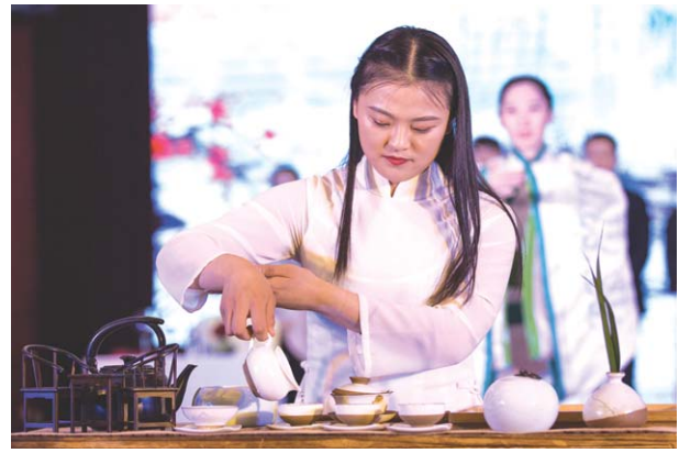
□刘兵 毕胜 报道

4月2日，由济南市旅游饭店业协会主办的济南市新生活创意秀暨旅游饭店职业服饰大赛在济南精彩上演，共有来自济南的9家高星级酒店参赛。参赛选手现场为大家充分展示了旅游饭店行业的服饰文化、茶艺文化、插花文化、特色饮食文化等饭店软实力。