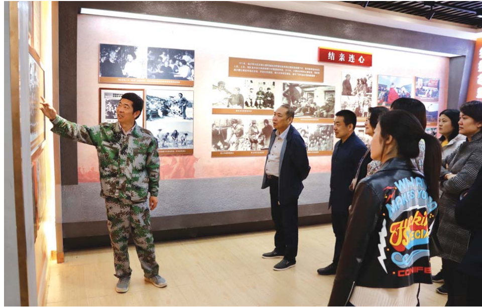
□记者 刘兵 报道

参加此次活动的山东省旅行社协会相关负责人也表示，桃棵子村地理位置优越，在旅游线路上可与周围的地下大峡谷、萤火虫水洞、蒙山龙雾茶博园、雪山彩虹谷等知名景区互为补充，形成环线。他们将积极与当地旅游部门对接，共同研究开发符合桃棵子村旅游发展的产品，鼓励支持协会会员将该村纳入自身营销渠道，组合编排“亲情沂蒙”新的旅游线路，并及时将桃棵子村纳入全省重要旅游线路，组织各地游客到该村研学旅行、休闲度假，促进当地农民增收致富。