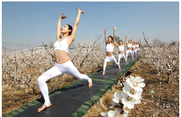
□记者 卢鹏 通讯员 高士东 报道

与往年相比，本届文化旅游节上展出的牡丹、芍药品种将增至1900余种，总量达到百万株，包括红魁、珊瑚落日、波斯美人等名贵芍药品种，新增其他花卉品种100多种，共计26万盆，这些花卉将与牡丹一同争艳。除了花卉品种数量较往年大量增加，花卉布展也有所不同，在搭配组景、造型和表现形式上都有新的突破。99个开满鲜花的花岛组成的林下花岛、应用新兴浮岛技术打造的水上牡丹、浪漫迷人的紫藤隧道、有园林“刺绣”艺术之称的模纹花坛等均值得期待。