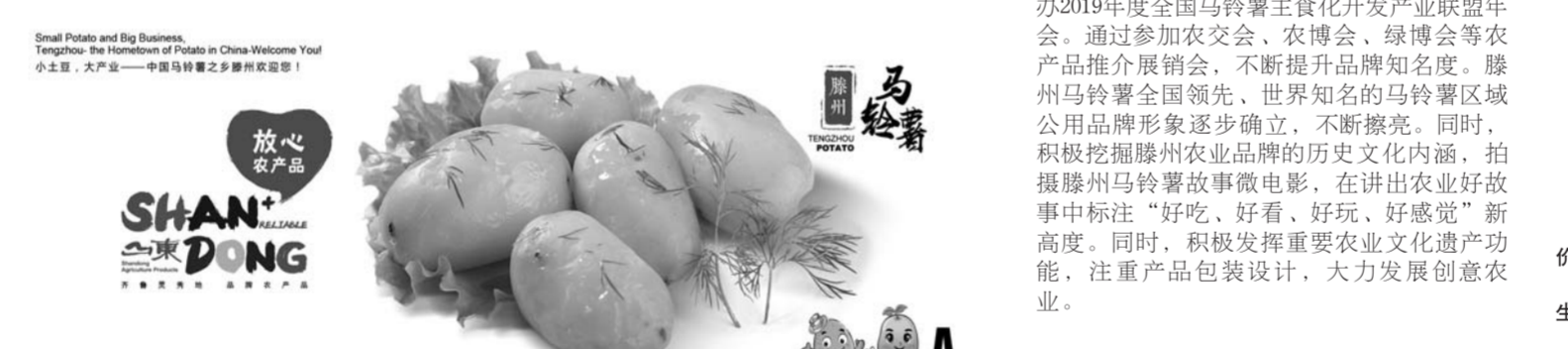
产品订购电话：0632-5805699 13306324857 13306329897 13869495184 15588283446

滕州市在全国率先建设县级马铃薯组织培养中心，年产脱毒种薯2000万吨，脱毒良种普及率100%。首创拱棚高效栽培技术，双膜、三膜、四膜栽培面积达到40万亩，推广使用配地膜、秸秆生物反应堆、水肥一体化、病虫害绿色防控等技术，真正实现生态高效。滕州马铃薯每年4月中旬开始陆续上市，比露天栽培提早45天以上，填补国内市场空白，抢占市场先机，滕州成为全国春马铃薯的价格形成中心。马铃薯单产水平持续提升，2017年最高亩产达7.9吨，在全国树立了“亩产万斤薯、千斤粮，产值过万元”的高产高效典型。主持研制出口春、秋马铃薯良好农业规范