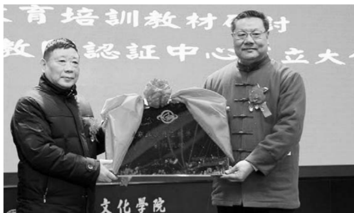
△中华传统文化教师传承中心成立

曲阜孔子文化学院以“传承孔子儒家思想，践行颜子陋巷精神，弘扬优秀传统文化”为宗旨，以加强新时期教师师德师风建设为主导，致力开展孔子文化教育培训、国际文化交流合作、发展孔子文化产业，为曲阜打造培训之都贡献力量。先后荣获“全国师道教育中心”、“教育部中央电化教育馆中华传统文化教师(讲师)传承中心”、“中国儿童少年基金会儒家文化教育基地”、“研学旅游示范基地”、“中国中小企业协会传统文化教育示范基地”、“北京市教育学会“中华优秀传统文化教师培训基地”、“山东省绿色生态休闲体育活动基地”、“曲阜市乡村儒学讲师培训基地”等称号。