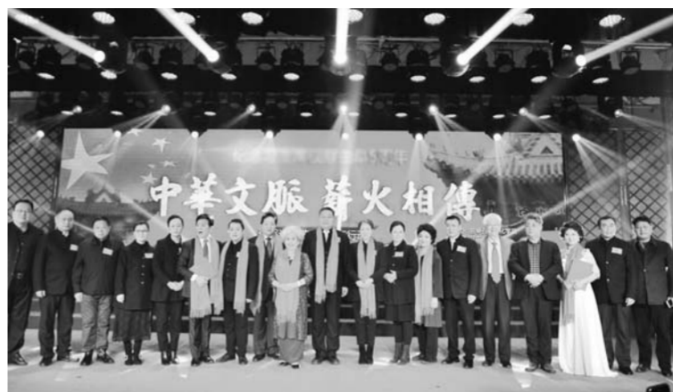
△“中华文脉 薪火相传——诵写讲经典 我们在行动”活动启幕

育和培训部MerSETA合作共同资助200名南非大学生到学院进行为期半年的学习实习项目。