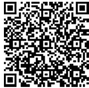
扫描二维码浏览短视频 (160秒!带你速览山东省石油天然气管道保护条例)

管道保护工作责任重大、使命光荣。我们将站在坚定“两个维护”的高度,站在“走在前列、全面开创”的高度,主动担当,狠抓落实,在新的起点上加强和改进管道保护工作,有效保障能源安全和公共安全,为新时代现代化强省建设作出积极贡献。