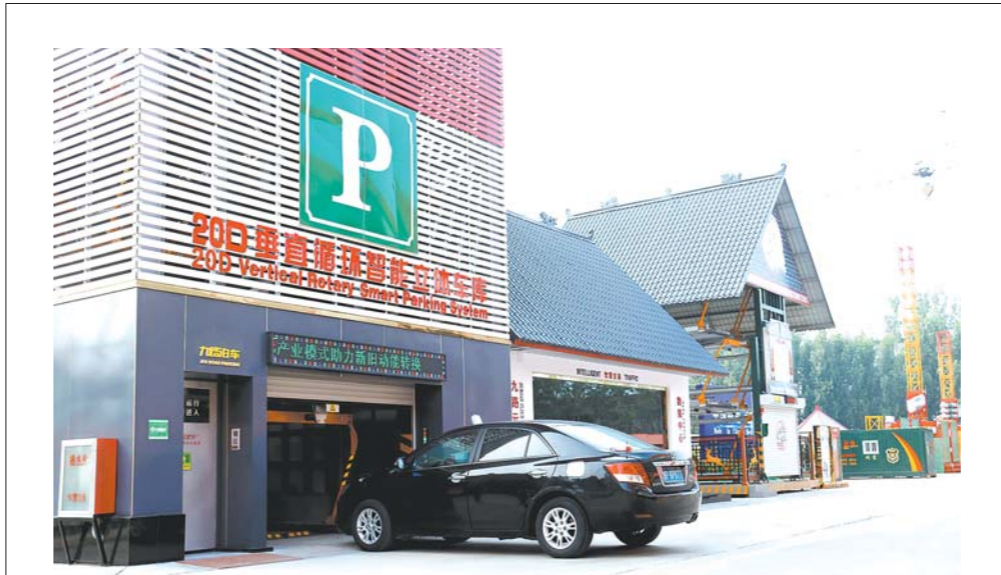
□ 王兆锋 赵永斌 报道 全国首家投入商业运营的物联网技术智能立体车库。聊城民营企业发展势头强劲，产智融合为企业插上腾飞的翅膀。

■2018年，对于聊城来说，是任务艰巨、压力倍增、爬坡过坎的一年，是励精图治、攻坚克难、努力拼搏的一年。全年经济社会发展呈现稳中有进、进中提质的好态势。