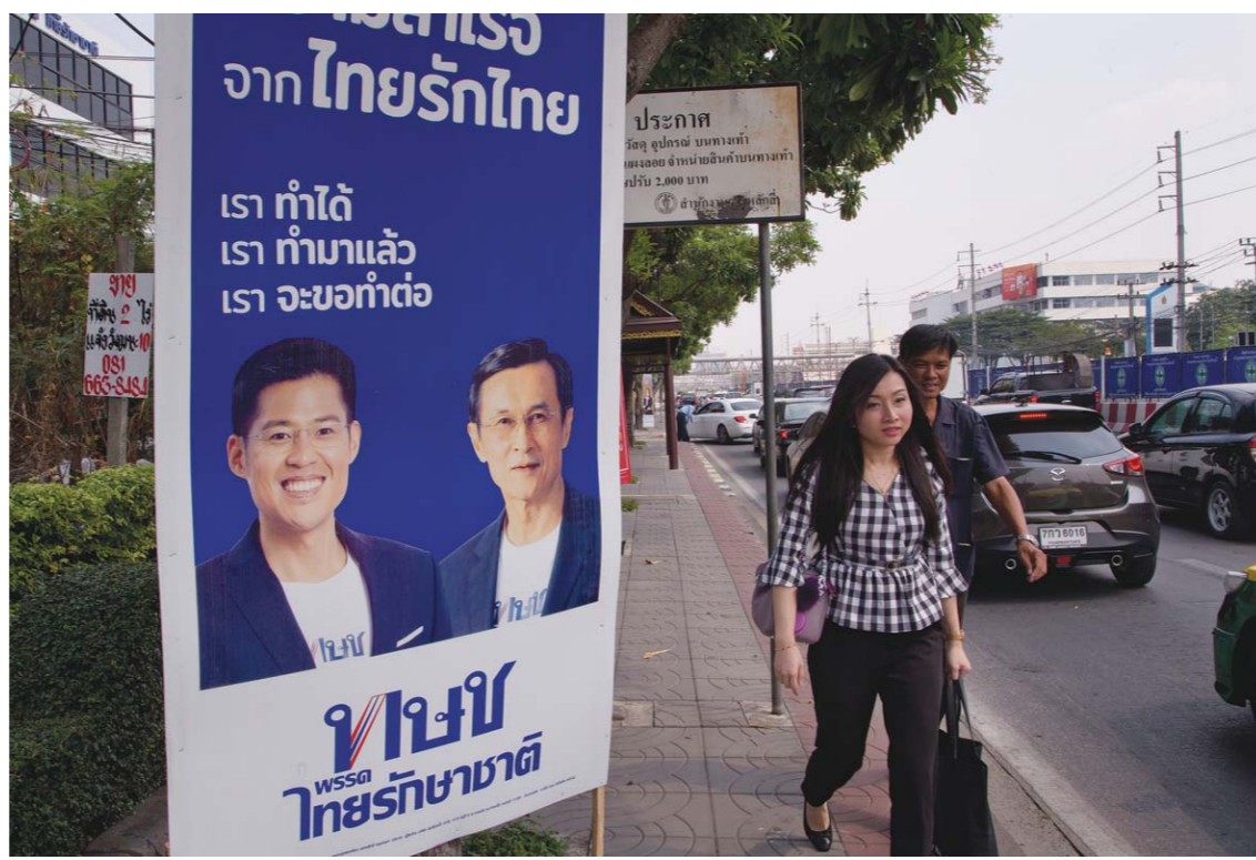
2月13日，在泰国曼谷，行人经过泰护国党的竞选海报。

综合新华社曼谷2月13日电 泰国选举委员会13日发表声明说，泰护国党提名王姐姐乌汶叻参选总理行为有违君主立宪制度，将提请宪法法院解散该党。 声明说，选举委员会12日通过决议，次日授权负责政党登记的官员为代表，正式向宪法法院提请解散泰护国党。 泰国《政党法》第92条规定，当选举委员会有充足证据认定某个政党的行为有违君主立宪制度，应提请宪法法院解散该党。 泰护国党13日表示，选举委员会不应只听一方观点，而应给予泰护国党解释的机会。 泰国定于3月24日举行近5年来首次大选。按照泰国法律，选民将选出500名下议院议员，全国维持和平秩序委员会指派产生250名上议院议员，最终由两院议员联合投票，选出新总理。 亲他信派政党泰护国党8日提名乌汶叻为该党总理候选人，引起泰国社会不小震动。 泰国当日公布国王玛哈·哇集拉隆功签署的公告，国王认为王姐姐乌汶叻仍是王室成员一员，而王室成员应保持中立，不能担任政府公职。泰国选举委员会11日依照国王公告和宪法，将乌汶叻排除在正式公布的各政党提名的总理候选人名单之外。 另据新华社报道，乌汶叻12日对议会选举前因她而出现“麻烦”表达歉意。 乌汶叻当天在泰国中部公开露面，当晚在社交媒体Instagram写道：“我想为国家、为泰国民众效力的真实意图，造成这个时代本不应出现的麻烦，我抱歉。” 她在文末附上标签：“怎么会这样”。 乌汶叻现年67岁，是前王后诗丽吉的长女。她1972年与一名美国人结婚并申请放弃王室成员地位，获准成为平民。乌汶叻1998年离婚后回国，泰国民众仍视她为王室成员一员。