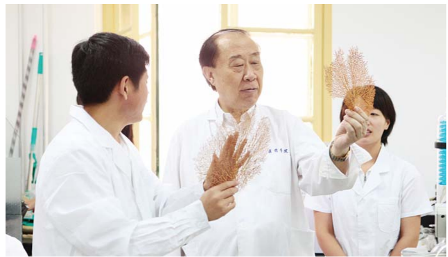
管华诗院士(中)和海洋药物科研团队一起工作。