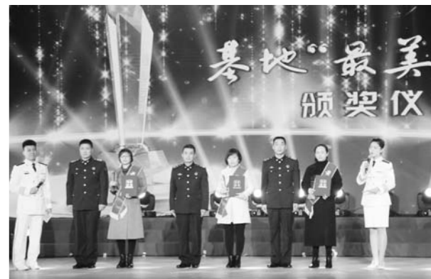
□记者 姜言明 通讯员 崔仲恺 报道

“我的中国梦·文化进万家”活动以中国梦为主题,以丰富基层群众文化生活为目标,组织发动全国文艺工作者在元旦、春节期间,深入村镇、社区、学校等基层单位,为百姓送去丰富多彩的精神文化食粮。朱庄村有着深厚的文化底蕴,孔子曾在此讲学施教,教化百姓,儒学大家朱熹的后人为沐孔子之圣泽迁居在此。