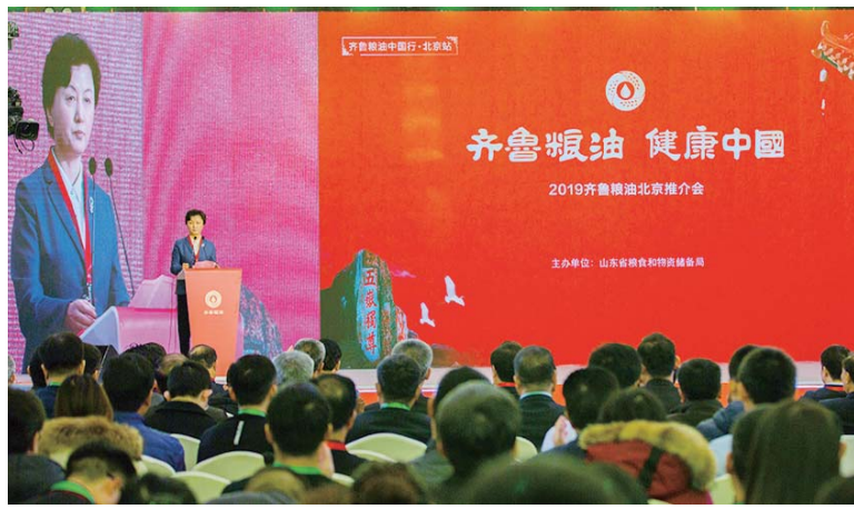
△山东省粮食和物资储备局局长王伟华在“齐鲁粮油”北京推介会上致辞。