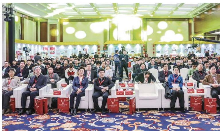
△来自北京的粮食经销商代表、渠道采购负责人代表等近260人参加了“齐鲁粮油”北京推介会。