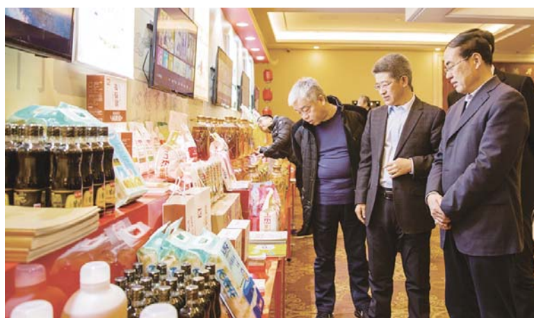
△参加“齐鲁粮油”北京推介会的代表在展台前参观“齐鲁粮油”相关产品,洽谈业务合作。

域公共品牌存在盲区等问题依然十分突出。为此,山东制定了《关于推进山东粮油品牌建设的实施意见》,着力通过打造“齐鲁粮油”公共品牌,将我省的粮食资源优势转化为竞争优势,促进粮食产业高质量发展。