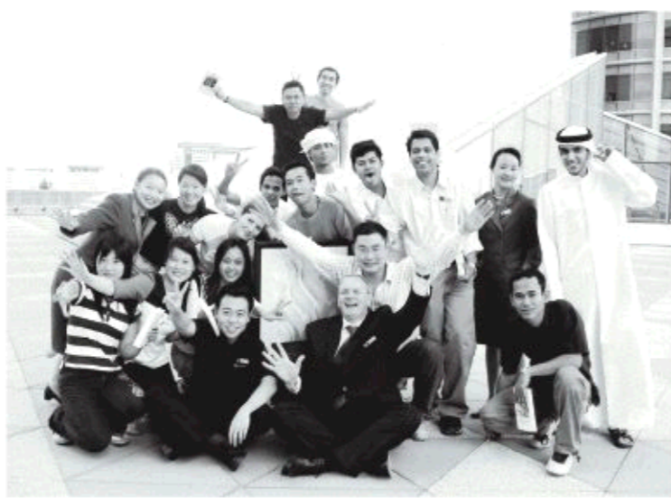
△在阿联酋七星酒店阿拉伯塔实习的学生和他们的同事

2018年6月8日，一个艳阳高照、生机勃勃的好日子，在位于龙山脚下、百脉泉畔的美丽校园里，山东旅游职业学院又为其2018届2000余名毕业生举行了供需见面会。同往年一样，又是招聘单位云集，又是毕业生被“哄抢一空”。来自国内外的460余家用人单位提出用人计划1.6万余名，供需比例1:8。正如一学生代表所讲：“作为山东旅院的学生，我们不是就业，而是择业。”一字之差，高下立见。其中的自豪感、自信心溢于言表。山东旅游职业学院院长宋德利介绍：自2004年升格为普通高等学校以来，毕业生已连续14年供不应求，许多学生毕业后走上了管理岗位。正是凭借突出的办学特色和强大的就业竞争力，山东旅院人才培养工作受到社会各界的高度评价。2018年，学院获国家教学成果奖二等奖1项，省级教学成果奖特等奖1项、一等奖1项、二等奖1项。