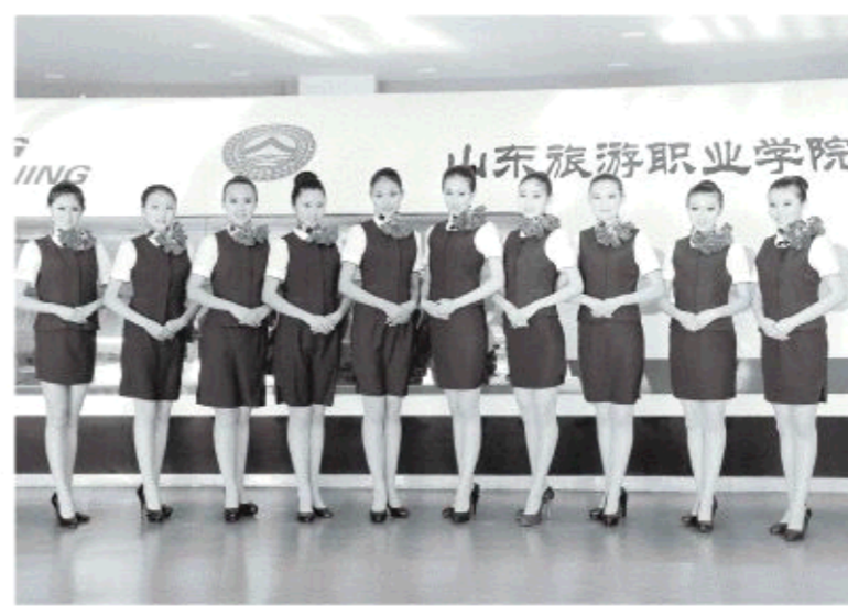
△航空服务专业学生在模拟舱前合影

业生，培训近70000名旅游及相关行业的优秀从业人员。一部分毕业生已担任旅游饭店、旅行社和旅游景区总经理，航空公司乘务长等职务。 28年来，山东旅院的办学水平得到了各级领导和社会各界的广泛赞誉。先后荣获全国职业教育先进单位、全国职业技术学校职业教育指导工作先进单位、全国国防教育特色学校、全国旅游职业教育校企合作示范基地、全省示范性高等职业院校、山东省名校建设工程首批技能型特色名校、山东省优质高职院校建设工程立项单位等各级各类荣誉100余项。学院党委被省委高校工委授予“科教兴鲁先锋基层党组织”称号，是受表彰的10所高校党委中唯一的职业院校。 28年来，山东旅院就像一列奔驰的火车，凭着异乎寻常的创业勇气、创造精神、创优智慧，抢占了中国特色旅游教育又一个制高点。作为一所年轻的学校，山东旅院何以能在短短的30年里取得如此骄人的成绩？对此，山东旅游职业学院党委书记陈国忠说：“这首先得益于党的改革开放政策，没有改革开放就没有山东旅院的今天；其次得益于中国旅游业特别是山东旅游业的蓬勃发展，是旅游业沃土哺育了年轻的山东旅院；第三，是我们准确把握了旅游职业教育的实质，那就是：以立德树人为根本，以服务经济社会和行业发展为己任，坚持改革创新精神，坚持文化立校战略，大力推进校企合一