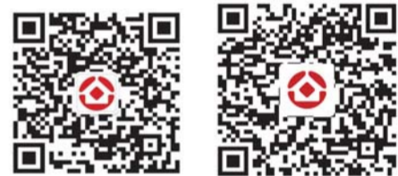
住房公积金公众号 住房公积金APP二维码