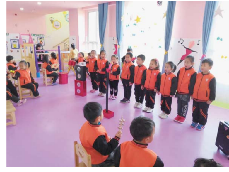
△大力开展普惠性幼儿园建设

解决城镇中小学“大班额”问题是各级党委政府惠及民生的重要举措。为全面解决城镇中小学“大班额”问题，金乡县委、县政府超前规划设计，多渠道筹措资金，妥善安排用地计划，全力加速推进工程项目建设。新增教育用地1100亩，两年内在城区新建中小学14所，政府投入10.29亿元；与此同时，加快以义务教育为主的合作办学项目建设，相继启动了金乡县金山实验学校、商贸物流区配套九年一贯制学校等项目。