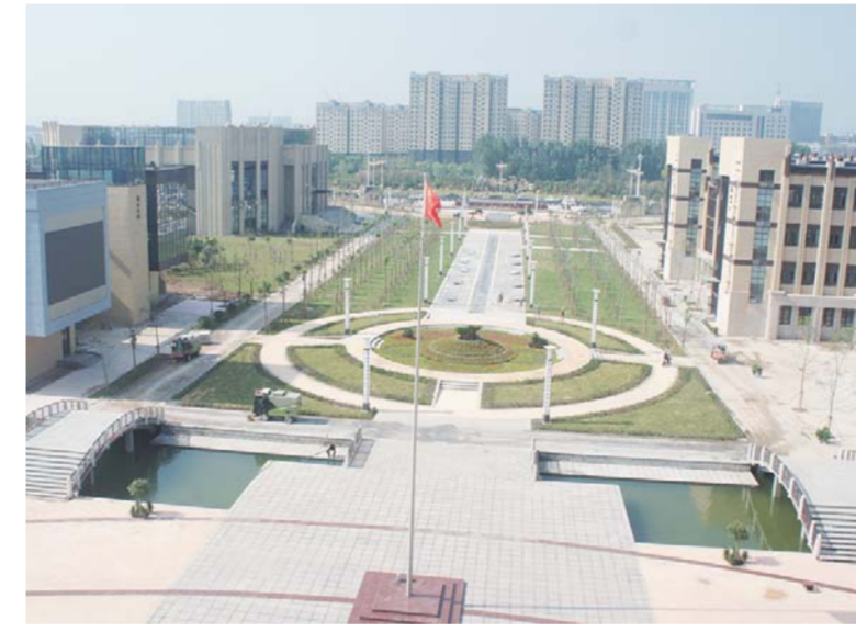
△莱河岸边，美丽的新一中校园

金乡县在2015年率先通过“国家义务教育基本均衡县”验收的基础上，又率先提出了创建全国“义务教育优质均衡发展县”的新目标，已经申报在2018年底达到创建条件。目前，金乡县各级各类学校抢抓机遇，进一步增强创建的紧迫感、责任感、使命感，全面把握义务教育优质均衡发展的新要求，全力突破优质均衡发展的重点难点，所有学校的章程制