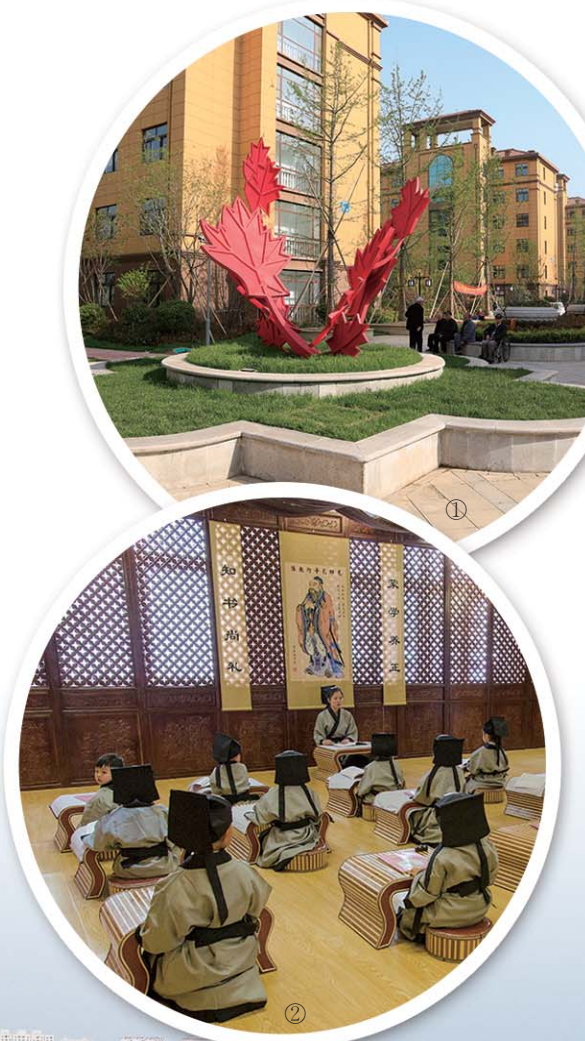
①已经投入使用的养老公寓，周到的服务和良好的环境让老人们安享幸福晚年 ②学前教育蓬勃发展。图为县城一处幼儿教育场所