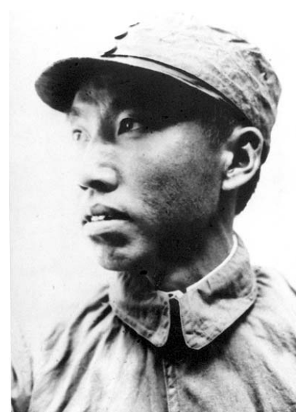
左权同志(资料照片)。

左权的英雄事迹可歌可泣，舍生取义的革命精神不断激励着后人。除了“左权路”，左权将军纪念碑、左权红军小学……左权家乡醴陵通过各种方式寄托人们对他的无限缅怀。(新华社长沙1月16日电)