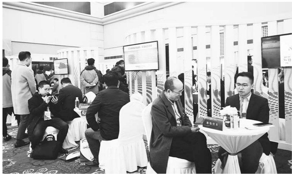
在山东“十强”产业资本对接活动上，不少创业者前来找资本、找资源。

破”。这需要调整投资结构进行调整，建立多层次的资本市场体系，其中必然涉及大力拓展直接融资渠道，但现在一个误区是，一说提高企业直接融资比重，各地就容易将其等同于公司上市或者企业挂牌。“实际上，这样的只能是少数相对成熟的优质企业。”中国投资协会副会长沈志群