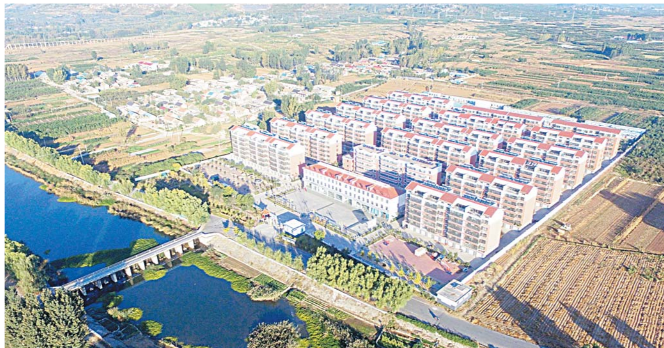
2018年,我省全年脱贫任务基本完成。图为临沂市朱田镇异地搬迁脱贫的崔家沟村。

这一年,山东牢记习近平总书记殷切嘱托,精心部署、扭住不放、持续用力,精准脱贫向深度贫困地区和人群聚焦发力,生态环保探索符合省情的系统解决之道,全力防范化解重大风险,把总书记的深情厚望转化为山东走在前列的磅礴力量。这一年,全省金融风险总体可控,全年脱贫任务基本完成,碧水蓝天常在,三大攻坚战取得突出成效,开局良好。