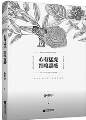
《心有猛虎 细嗅蔷薇》 余光中 著 江苏凤凰文艺出版社

这部作品以经济改革为主线，表现了1978年至2008年中国改革开放的历程，展现了经济领域的改革、社会生活的变化、政治领域的变革以及人们精神面貌的变化。