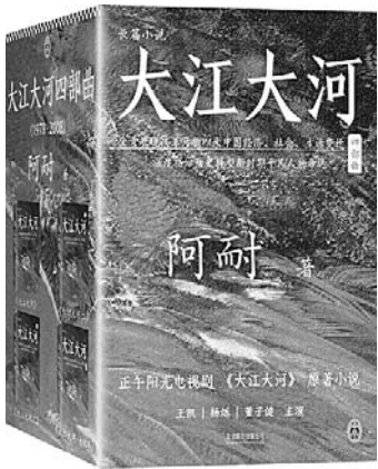
《大江大河》 阿耐 著 北京联合出版公司

这部作品以经济改革为主线，表现了1978年至2008年中国改革开放的历程，展现了经济领域的改革、社会生活的变化、政治领域的变革以及人们精神面貌的变化。