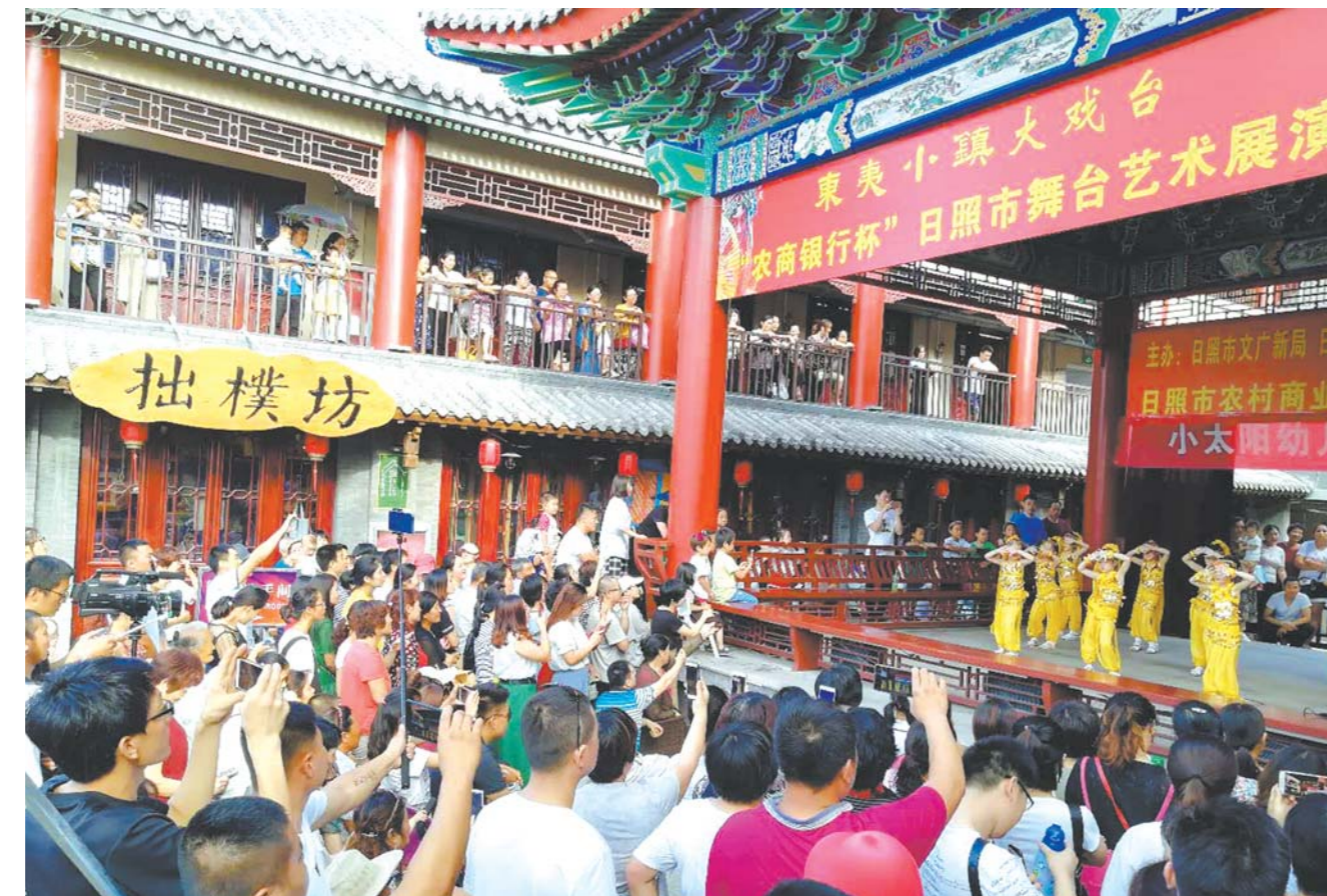
图为在东夷小镇大戏台举办的日照市舞台艺术展演。（资料图）

□记者 丁兆霞 通讯员 安蒙 报道 本报日照讯 少年儿童合唱比赛、青少年舞蹈大赛、老年艺术大学校园艺术节，覆盖各年龄段、包容多种演出形式的展演，让每一位市民都能找到喜欢的节目、表演的舞台；太阳文化专题摄影作品展、农民画陈列展、大型艺术展，不仅是城市形象推介的窗口，也为市民开辟了才艺展示平台；尼山书院开展亲子素养教育“新三好”“国学夏令营”等活动，日照市图书馆城市书房举办免费公益讲座，一系列培训和讲座，成了市民的艺术课堂。 今年6月至10月，以“活力日照·乐享文化”为主题，以演艺表演、展览展示、艺术讲坛三大板块为重点的日照市民文化艺术节，用124项主题文化活动，实现了“周周有活动，月月有赛事”，开启了一场城市文化的嘉年华，实现了全城参与、全城欢动、全城共享。 公共文化服务是满足人民群众基本文化需求、保障人民群众基本文化权益的“主渠道”，是赢得群众支持、汇聚群众力量的“主阵地”。今年以来，按照“政府主导、社会参与、重心下移、共建共享”的思路，日照市以基本公共文化服务标准化均等化为抓手，聚焦解决文化权益基本保障、文化服务基本供给、文化活动基本需求，着力构建现代公共文化服务体系，打通公共文化服务“最后一公里”，让群众在家门口就可以邂逅“诗和远方”。