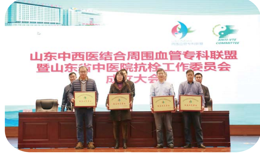
2018年1月牵头成立山东省中西医结合周围血管专科联盟及省中医院抗栓工作委员会

目前，周围血管病科的微创诊断血管病国内领先水平，周围血管病科拥有G700彩色超声多普勒诊断仪、B超机等先进设备，可以对闭塞性动脉硬化症、糖尿病足、血栓闭塞性脉管炎、多发性大动脉炎、雷诺病、深静脉血栓形成、淋巴水肿等多种血管病进行高水质的诊断和鉴别诊断。该科在周围血管病诊断方面取得了较大成绩，就周围血管病疑难疾病的诊断发表了多篇有价值的学术论文及著作，诊疗水平国内领先。