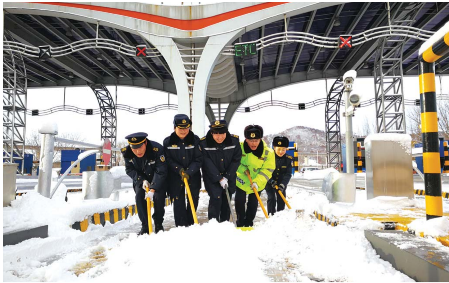
□通讯员 彭川东 曲亚楠 报道

中铁上海局潍莱高铁项目部参与了潍坊至莱西铁路站前施工3标段施工建设,工期36个月。潍莱高铁是山东省内“三横”快速铁路网的“中部通道”,设计时速350公里,正线全长122.63公里,将于2020年建成通车。