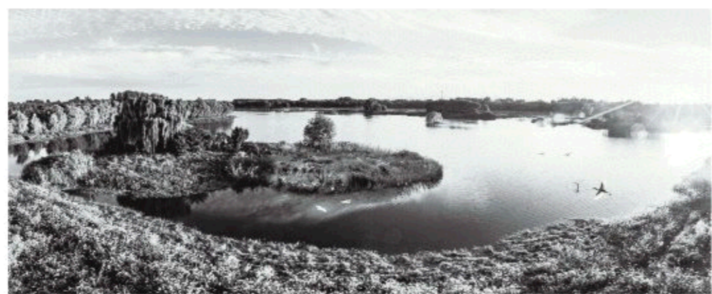
△青州弥河国家级湿地公园

老头说道：“这巨洋水，从头到尾有四百多里，从天齐湾一直流到大海，东海龙王就派他的两个儿子，一个住在天齐湾，一个住在老龙湾。这龙王和百姓关系挺好，哪家缺东西了，都可以向龙王借。周围村子老百姓有红白喜事，到河边摆些祭品，把需要的碗碟之类数目告诉龙王，东西便会按数从湾水中漂上来，用完之后再还回去就行了。龙王家的东西都是金碗玉碗，看到这么贵重的东西，借的人就起了贪心。这一户人家偷着藏一只金碗，那一户人家偷着藏一只玉碗，时间一长，龙王就发现了。龙王很生气，看到世间的人人都这么贪心，就再也不借东西了。做人不管当官还是平民，守信用才行，不能起贪心。”