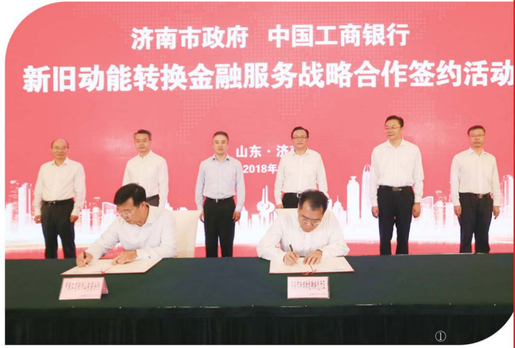
济南市政府 中国工商银行 新旧动能转换金融服务战略合作签约仪式

山东省上市公司纾困基金。省国资委安排山东国惠集团、中泰证券牵头组建上市公司100亿元纾困基金，首期规模约40亿元，该行已向基金出具了20亿元的出资意向函，目前项目标的正在沟通对接中。另一方面综合运用投行手段支持民营上市公司，该行已初步完成大股东质押比例超过50%的客户梳理工作，正在筛选重点目标客户，拟逐户走访对接，了解增持、回购或出售上市公司控股权等需求，进行“一户一策”，尽快推动方案落地。