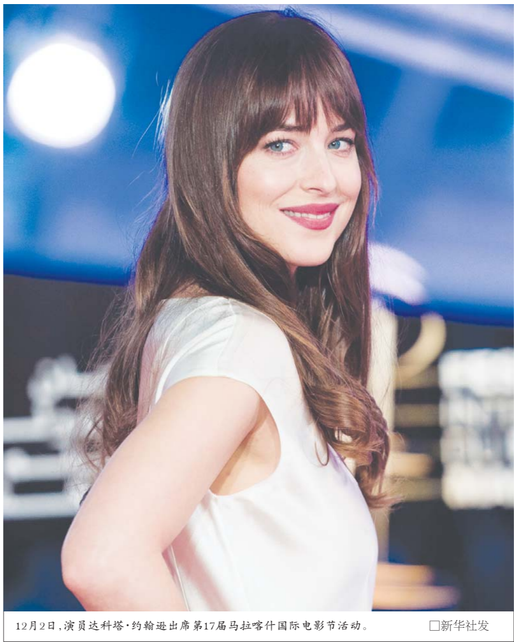
12月2日，演员达科塔·约翰逊出席第17届马拉喀什国际电影节活动。

舞台是表演的养分提供地，是对已消耗表演能力的一种凝聚。对待舞台是这样的态度，而多年来在电视剧领域步履不停地创作，李立群则一直强调这是一种“妥协的艺术”。但妥协并不是胡乱妥协，而是市场环境下的必然的产物，时间、制作成本，都是一定要衡量进来的要素。“电影可能用一年、两年拍出来90分钟，电视剧三十集戏的体量却要用三个月就完成，客观条件存在，是一定会导向相应的结果。”李立群表示，无论电视剧的特质如何，他都格外感谢电视剧，这是让他跟广大观众用表演神交的最广阔平台，是来之不易的缘分。“作为演员，只要尽全力地表达角色，即使真的被剧本挡住很多，观众的眼睛还是雪亮的，会分辨出孰优孰劣。所以只要肯用心，演员基本的光芒还是会表露出来。”