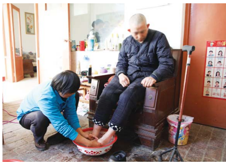
居家托养服务人员照顾残疾人生活起居。

济南市残联立足智力、精神残疾人及重度肢体残疾人实际状况,认真贯彻落实残疾人托养服务政策规定,以改善残疾人民生为中心,以建设完善残疾人托养服务机构为抓手,强化残疾人托养服务理念,通过探索创建模式、规范创建标准,完善托养服务政策、强化扶持指导、鼓励社会力量参与等措施,健全完善残疾人托养服务体系,建立了以机构托养为指导、社区照料为补充、居家托养为基础的托养服务机制,使智力、精神残疾人和重度肢体残疾人得到不同程度的托养服务,实现了“托养一个人,‘解放’一群人,幸福一家人”的托养服务格局,让智力、精神残疾人和重度肢体残疾人不再成为其家庭的负担和累赘。