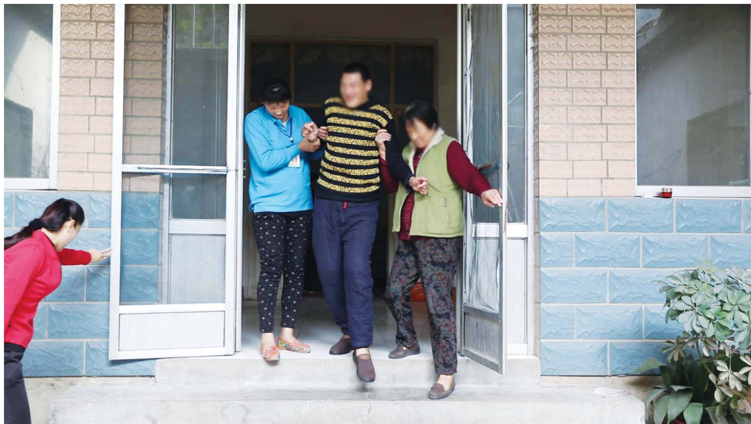
服务人员和家人一起帮助残疾患者进行康复训练。

级三个级别,市级残疾人托养机构建筑面积应不低于3000㎡,拥有床位50张以上;区县级残疾人托养机构建筑面积不低于1000㎡,拥有床位30张以上;镇办(社区)级残疾人托养机构具备为残疾人提供托养服务的场地,托养残疾人数量应达到8人以上。按托养服务模式可分为寄宿式托养和日间照料式托养,托养机构可根据自身实际条件提供寄宿服务和日间照料服务。根据扶持政策要求,残疾人托养服务机构必须建立健全各项管理制度,做到行政、照料和护理、训练和庇护、辅助性就业、安全、财务等档案齐全,一人一档,工作人员与托养人员比例达到1:5,接收托养服务对象必须为就业年龄段(男16—59岁,女16—49岁)智力残疾人、稳定期精神残疾人、重度肢体残疾人,存在智力残疾或精神残疾的多重残疾人。只要符合补贴条件的残疾人托养服务机构,都可按照实际接收托养残疾人人数申请生活技能补贴、职业技能培训、开展生活照料等项目补助经费,寄宿式托养服务每人每月补助800元、日间照料托养服务每人每月补助600元。近年来,全市仅市本级已投入4000余万元,新建、改(扩)建或依托专业机构、养老机构和社区建立托养机构40余处。