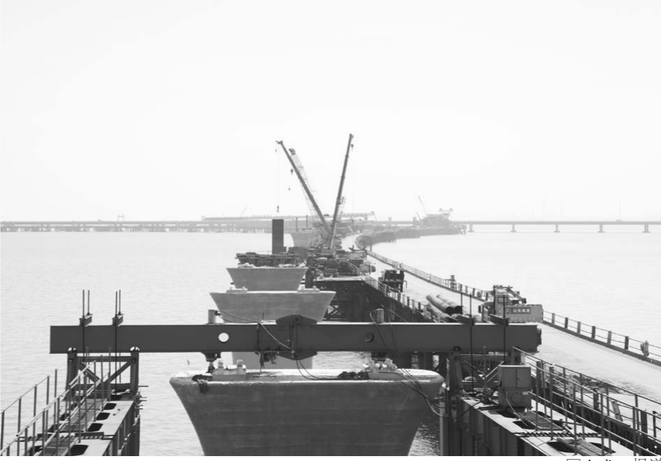
□白晓 报道 青岛胶州湾大桥胶州连接线建成后，胶州市与青岛主城区距离将缩短至20公里，15分钟车程。目前工程已施工过半，将于2020年6月建成通车。

但就在最近，副食水果超市老板发现，复印业务突然大幅下滑。打听才知道，原来，为推动“一次办好”，岚山区人社局全面精简业务流程，减少申报材料，尤其是清理各类不必要的复印件。对身份证等复印件，不再要求办事群众提供。若有必要，一律提供现场免