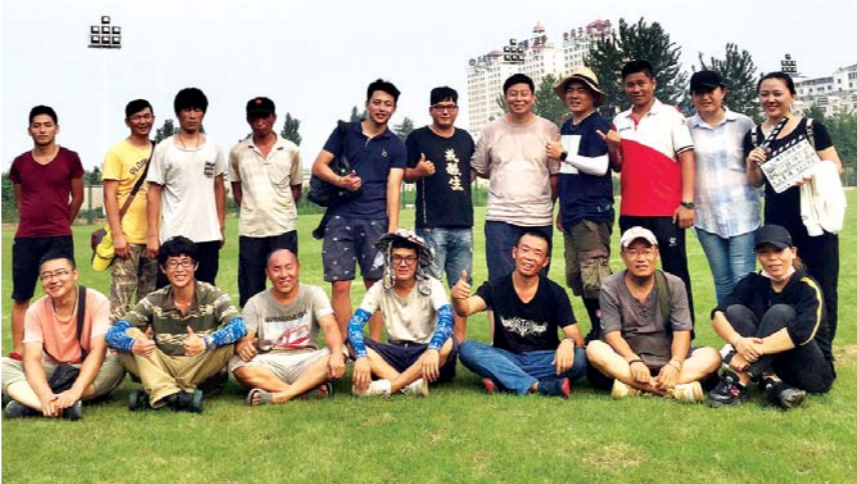
《两个人的足球》拍摄团队。

截至目前,该影片已在央视网、腾讯网、优酷网、搜狐视频、爱奇艺等十几家国内有影响力的网站首页播出,得到了网民的高度评价。此外,影片还获得过中宣部、中央网信办主办的2017年社会主义核心价值观微电影优秀作品奖、国家新闻出版广电总局主办