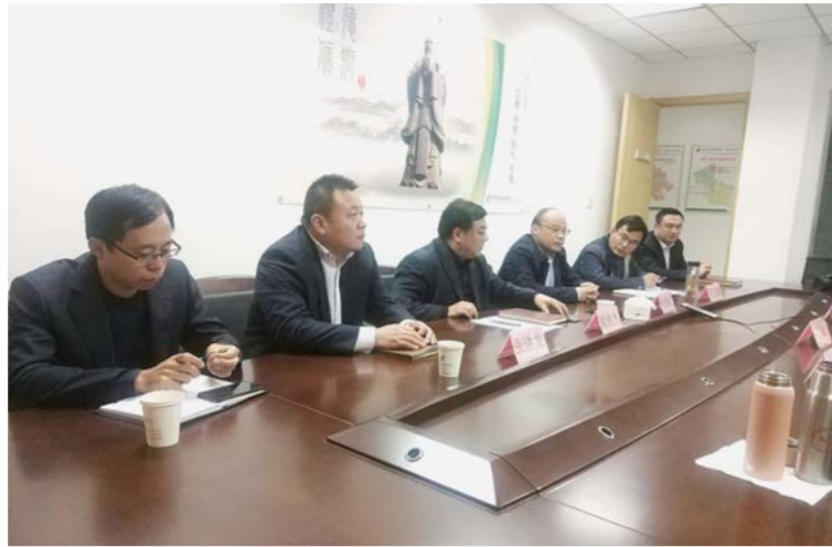
△邮储银行泗水县支行积极响应政银企对接会