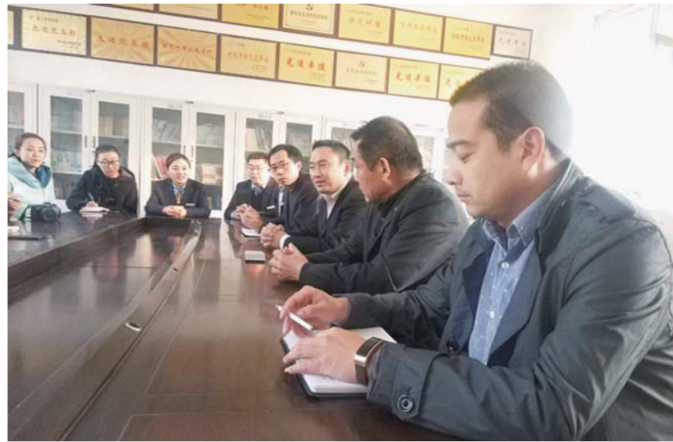
△邮储银行泗水县支行在星二村开展信用教育