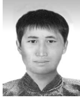
丁思林的画像。 □新华社发

不久前的深秋时节，记者走进大别山革命老区的湖北省红安县杏花乡阮店村丁家岗时，只见一派繁忙的丰收景象——村前的田地里，几位农民正在忙着挖红薯，不远处几台收割机正在稻田收割晚稻，村湾里还有几户人家正在翻新加盖小洋房。这个小山村，是抗日英烈、原八路军129师386旅新1团团长丁思林的家乡。 丁思林，1913年4月出生在湖北黄安(今红安)县丁家岗一个贫苦农民家庭。1933年9月加入中国共产党。1932年5月参加红军。曾任班长、排长、连长、营长。1934年后，任红四方面军第31军第93师第274团参谋长、第271团团长。1935年参加长征。 全国抗日战争爆发后，丁思林任八路军第129师386旅772团1营营长。1938年9月，任386旅新1团团长。他以英勇的精神和紧张的工作，协同与团结全团官兵，把一个新的部队，锻炼成一个有战斗力的、富于我军优良传统的主力团。1939年2月，在曲周县香城固的伏击战中，全歼日军安田中队和40队队补充大队，打死日军250余名，俘虏8名，毁掉汽车9辆，缴获火炮3门，枪百余支，粉碎了敌人破坏冀南根据地的阴谋。因表现出色，新1团被八路军总司令朱德誉为“模范青年团”，后又被八路军前方总部授予“朱德青年团”的光荣称号。 1939年7月5日，日军109师团107联队3000多人向晋东南抗日根据地大“扫荡”。6日，丁思林率新1团在云泽镇同敌人激战两天。8日，日军纠集兵力再次发动进攻，为掩护部队撤退，他主动阻击日军进攻。激战中，丁思林头部中弹，壮烈牺牲，时年26岁。