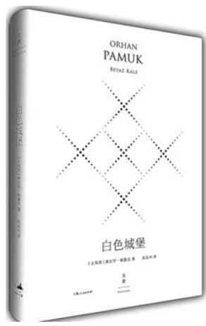
《白色城堡》 [土耳其] 奥尔罕·帕慕克 著 上海人民出版社

设计不止于设计，它深深渗入文明的肌理。人类通过设计，将世界的真实呈现出来，并将自我的真实传递给世界。将“时间设计”与“个人知识”当作重点来分析，试图说明一个现代社会中的自由体应该如何利用自己的智慧设计生活。