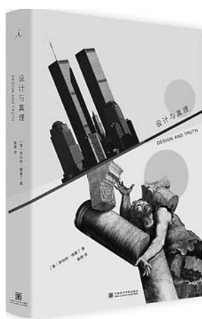
《设计与真理》 [美] 罗伯特·格鲁丁 著 中国美术学院出版社

设计不止于设计，它深深渗入文明的肌理。人类通过设计，将世界的真实呈现出来，并将自我的真实传递给世界。将“时间设计”与“个人知识”当作重点来分析，试图说明一个现代社会中的自由体应该如何利用自己的智慧设计生活。