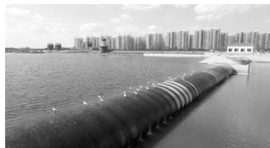
□丁兆霞 林坤 报道 作为岚山区林水会战的重点工程之一,岚山区绣针河的锦绣公园建设工程,地面铺装和绿化亮化工程已进入收尾阶段。绣针河综合治理工程按照“生态优先、因地制宜、城市互动”的原则,主要建设了入海口生态湿地保护区等项目,努力实现人、水、自然与生态和谐共处。

□记者 丁兆霞 通讯员 中永斌 报道 本报日照讯 近日,中国融资担保业协会公布《关于批准东北中小企业信用再担保股份有限公司等23家机构成为副会长、理事、会员单位的通知》,批准岚山融资担保有限公司成为会员单位。 岚山融资担保公司成为中担协会员后,能够共享全国融资担保业前沿政策、最新行业动态、金融咨询和业务合作等优势资源,对于提升公司业务水平具有重要意义。