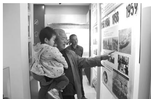
□丁兆霞 王绪君 报道 近日,在岚山头街道官草汪居,岚山区首座“渔村记忆”村史馆建设完成。一件件老物件都在讲述村子的古老故事和发展变化,记录了这个有500多年历史的小渔村的变迁。

认,该区明确了认定的11种情形,不予认定的4种情形,丧失成员身份的7种情形。按照“尊重历史、照顾现实、程序规范、群众认可的原则”,各村在区、镇成员身份认定指导意见的基础上,根据各自村情制定了成员身份认定办法,并入户进行户籍确认,特别是要照顾特殊群体的利益,不在成员身份认定上出岔子,既不能重复享受,更不能“两头落空”。 随着农村集体产权制度改革推进,岚山区沉睡着的集体资产正逐步被唤醒。截至10月9日,375个村居托清了党员债权底子,356个村居托清村(居)民债权底子,规范完善合同5892份,清缴侵占集体资产4370.18万元。