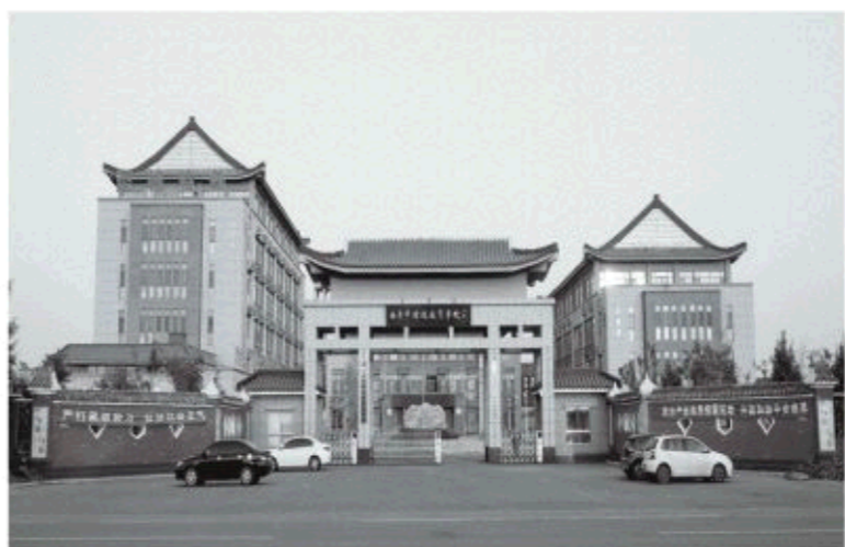
△曲阜市特殊教育学校正门

能训练、感统训练……改善身体机能,促进身心发展。不出校门就解决了残疾儿童最迫切的两大需求,曲阜特校的“医教融合”走出了一条一站式解决残疾儿童医教问题的新路径。