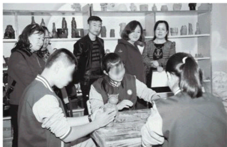
△陶艺制作是曲阜市特殊教育学校的特色课程之一

以“为残疾学生平等健康的未来生活奠基”为办学宗旨,曲阜特校坚持探索科学化、精准化、人性化的教育方法,用春风化雨的殷殷大爱营造有温度的教育氛围,形成了教育与医疗康复相互融合,学校教育家庭教育互为补充,共性教育与个性教育相辅相成的全方位教育体系。如今这里已成为残疾儿童学习知识、康复训练、塑造人格的温暖之家,为他们走入社会、走向未来铸就坚实的起点。